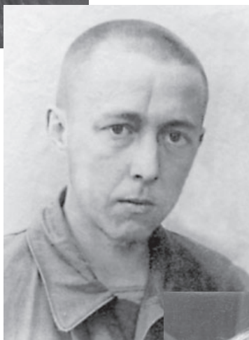
ЛАГЕРЬ НА КАЛУЖСКОЙ ЗАСТАВЕ. 1946