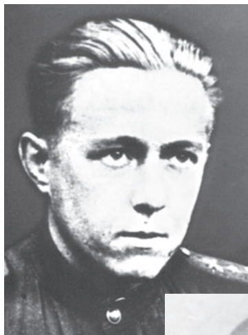
БРЯНСКИЙ ФРОНТ. 1943