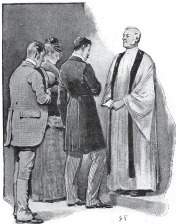
Все совершилось в одну минуту...

— Дело приняло неожиданный оборот, — сказал я. — Что же дальше?