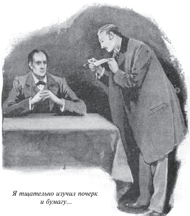
Я тщательно изучил почерк и бумагу...

мы отовсюду получили. Будьте дома в этот час и не считайте оскорблением, если посетитель будет в маске».