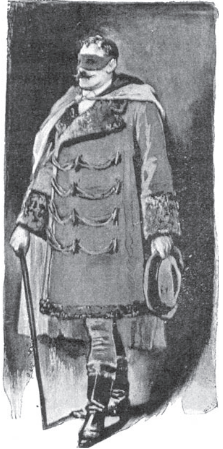
Вошел человек геркулесова сложения.

— Можете называть меня графом фон Крамм, богемским дворянином. Полагаю, что этот джентльмен, ваш друг, — человек чести, достойный полного доверия, и я могу посвятить его в дело чрезвычайной важности? В противном случае я предпочел бы беседовать с вами наедине.