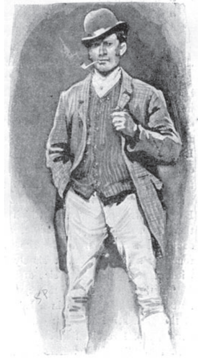
...вошел подвыпивший человек, по внешности конюх...

— Что она вскружила голову всем мужчинам в квартале и что вообще она самый лакомый кусочек на нашей планете. Так в один голос утверждают серпентайские конюхи. Живет она тихо, выступает в