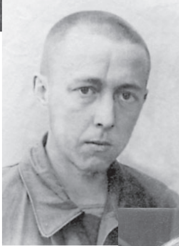
ЛАГЕРЬ НА КАЛУЖСКОЙ ЗАСТАВЕ. 1946