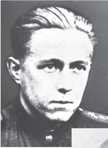
БРЯНСКИЙ ФРОНТ. 1943